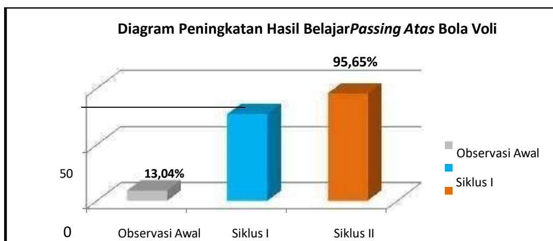
Gambar 3. Diagram Batang Peningkatan Hasil Belajar Passing atas

Berdasarkan pemaparan tersebut, peningkatan hasil belajar passing atas bola voli pada siswa Kelas V SD Negeri 3 Tulamben Tahun Pelajaran 2023/2024 dapat dilihat dalam diagram batang seperti pada gambar 4.8 sebagai berikut.